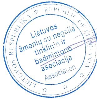
· Tomas Kiveris